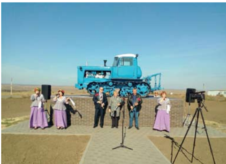
Установка памятника труженикам села