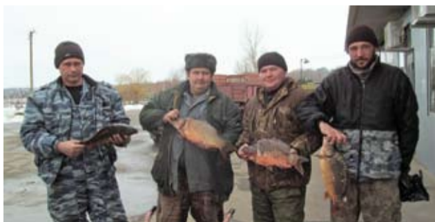
Рыбаки «Миусского лимана»

– В конце апреля – начале мая 2018 года посадили на выращивание в водохранилище «Миусский лиман», свыше 4 миллионов штук годовиков карпа, толстолобика, белого амура навеской 30-60 граммов. Лето было довольно жарким. Для производства продукции пастбищной аквакультуры – это благоприятные условия. Навески были хорошие. Карп вырос